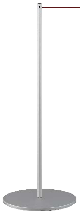
LINE BASIC CARACTERÍSTICAS