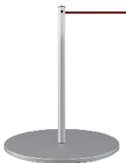
LINE MINI CARACTERÍSTICAS